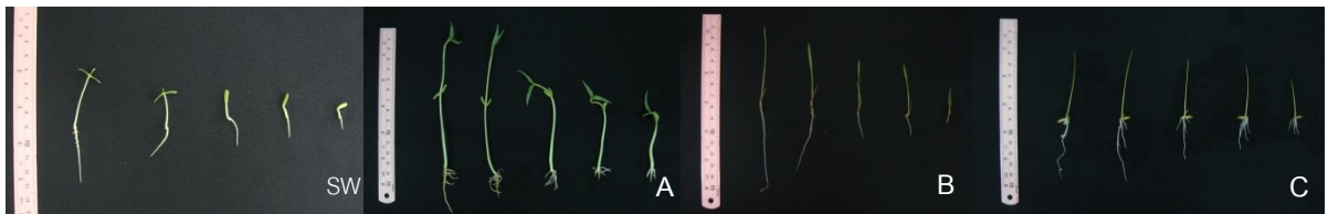
Figure 2 Effect of rice straw extract which concentrations are 0.00, 1.25, 2.50, 3.75 and 5.00 g/l from left to right on giant mimosa (A), mung bean (B), rice (C) and barnyard grass (D).

กรณีผลงานเป็น ภาษาไทย หากมี รูปภาพ/ตาราง ให้ใช้หัวตาราง/ รูปภาพ คำอธิบาย เป็นภาษาอังกฤษ รวมทั้งระบุ เนื้อหาในตาราง เป็นภาษาอังกฤษ ทั้งหมด