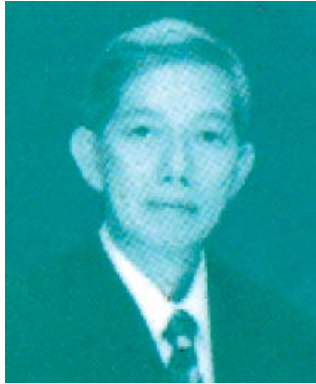
ศาสตราจารย์ ดร.กัญญา สัมพันธ์รักษ์ หัวหน้าคณะนักวิจัยผู้พัฒนาพันธุ์ ข้าวฟ่างพันธุ์ เคยู 257 ข้าวฟ่างพันธุ์ เคยู 439 ข้าวฟ่างพันธุ์ เคยู 630 ข้าวฟ่างลูกผสมพันธุ์ เคยู 8501